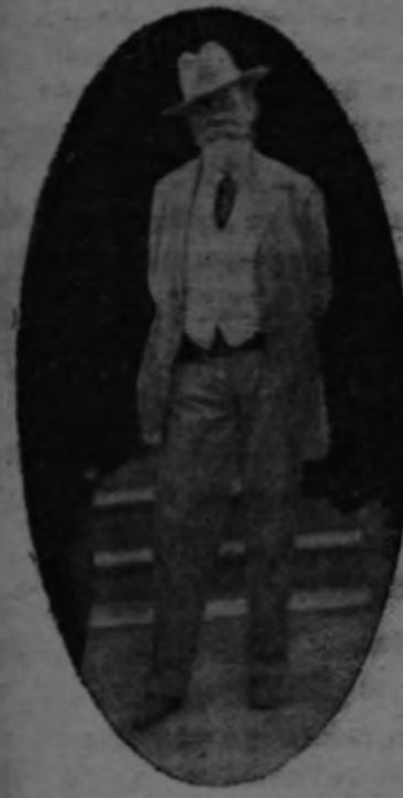
VENUSTIANO CARRANZA Jefe de la revolución mexicana en el Norte, y actual Gobernador del Estado de Coahuila.

Guaymas cayó ayer en poder de la revolución